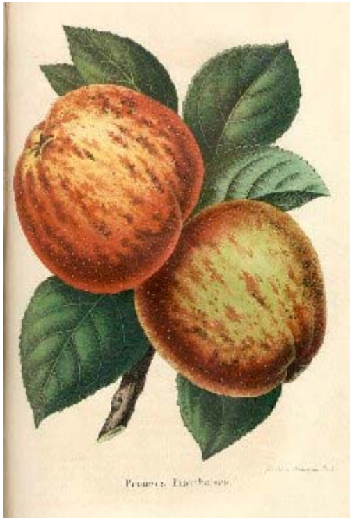
1856, La Belgique horticole = Framboise.

A.Royer, Annales de pomologie belge et étrangère= Pomme Framboise et Morren,